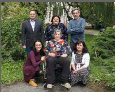
zaměstnanci správy Charity Hranice