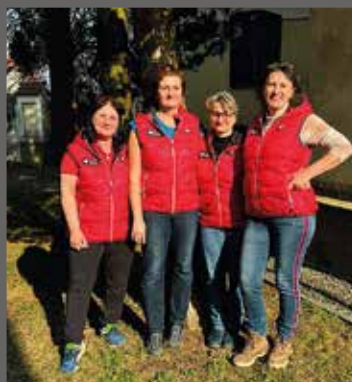
pracovnice Domácí zdravotní péče středisko Lipník nad Bečvou