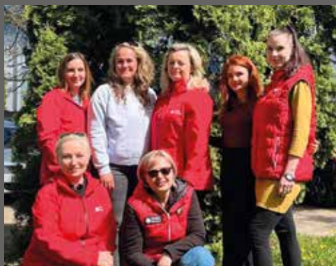
pracovnice Charitní pečovatelské služby středisko Hranice