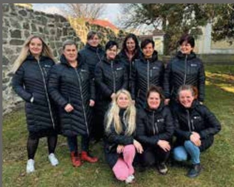
pracovnice Charitní pečovatelské služby středisko Lipník nad Bečvou