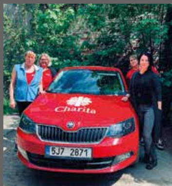
pracovnice Domácí zdravotní péče středisko Hranice