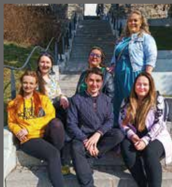
pracovníci Nízkoprahového zařízení pro děti a mládež Fénix