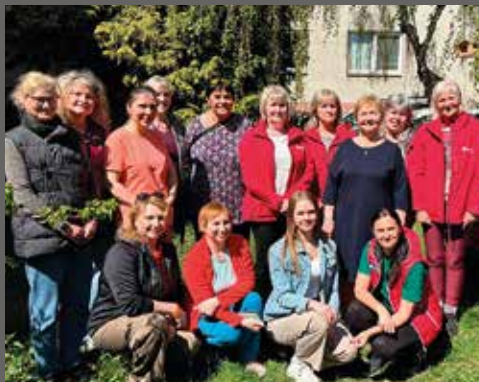
pracovnice Osobní asistence