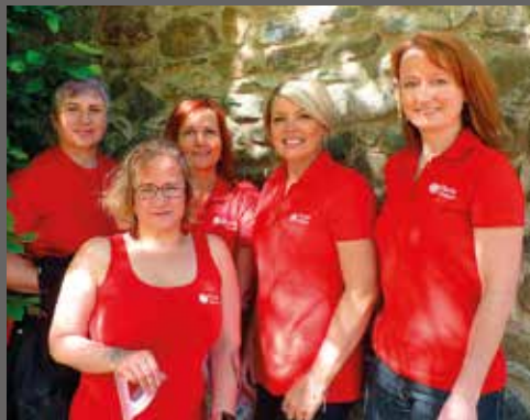
pracovnice Denního centra Archa